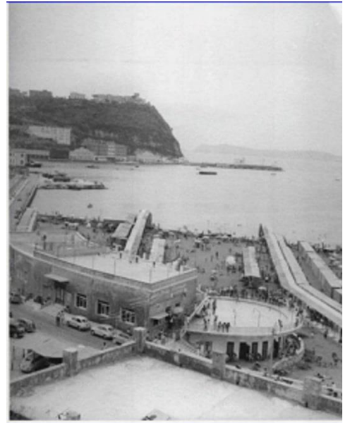
Lido Pola 1960