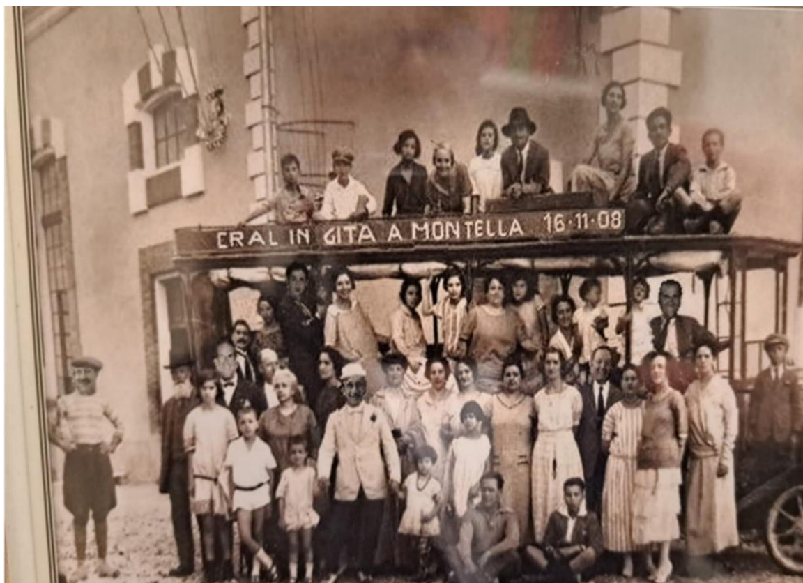
Foto del 1908 rinvenuta nel nostro archivio di Via Verdi, Napoli