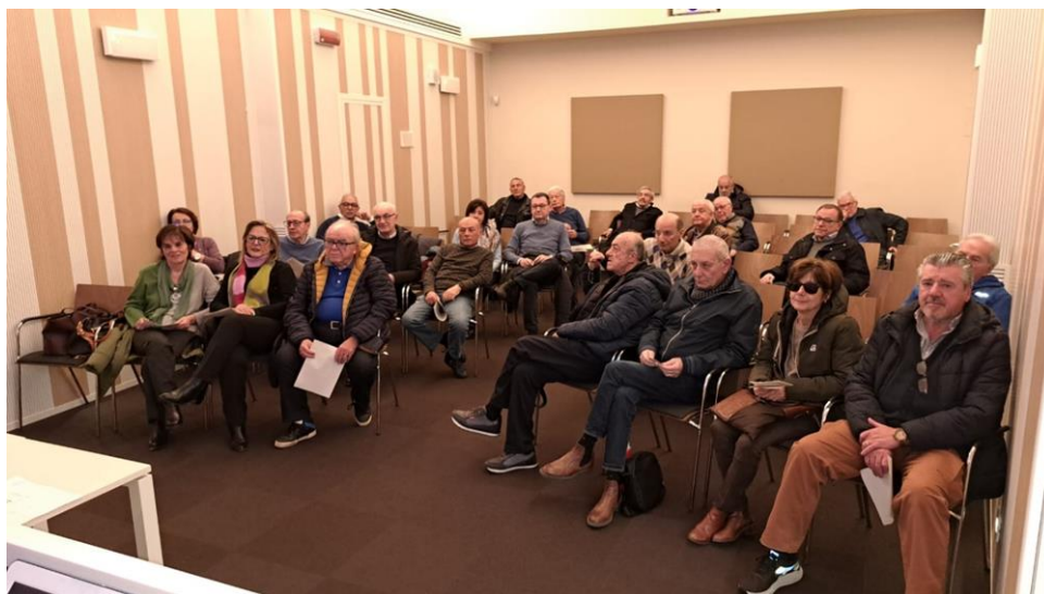
Assemblea Ordinaria degli iscritti del 13 marzo 2024