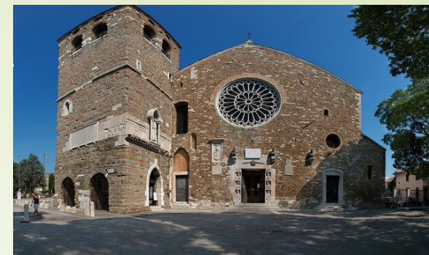
Trieste: S. Giusto