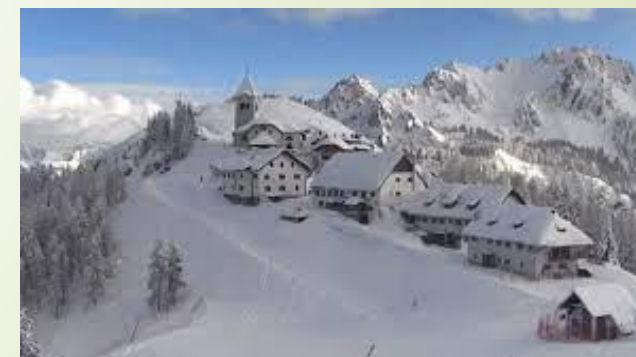
Tarvisio (UD) – Monte Santo di Lussari