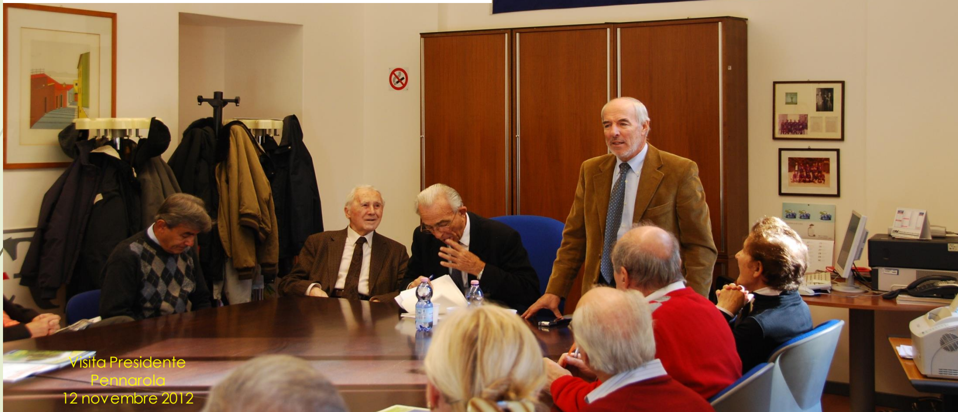
Visita Presidente Pennarola 12 novembre 2012